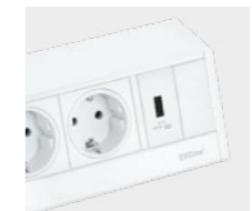
Blanc / blanc