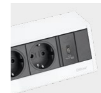
Blanc / noir